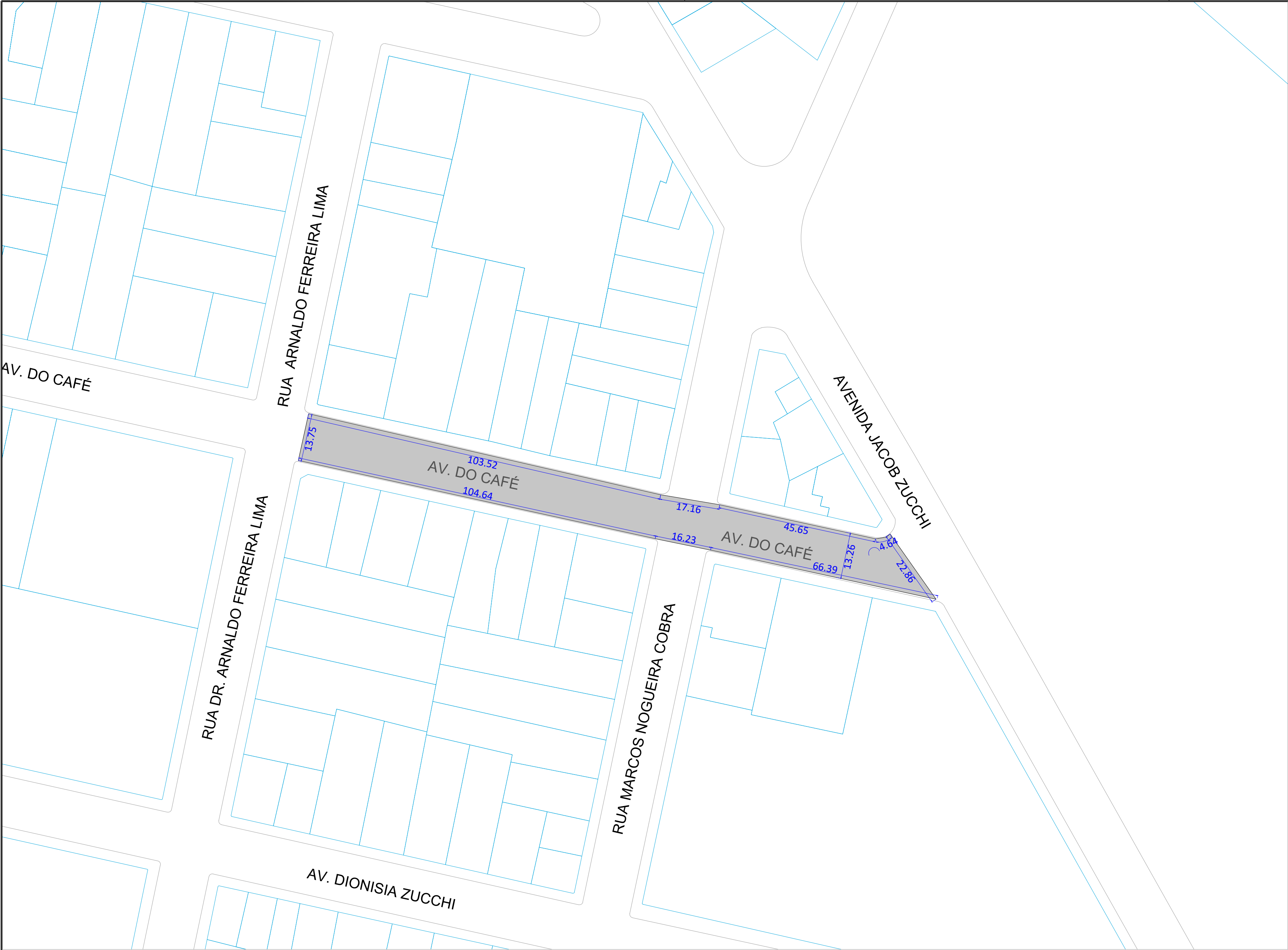
PROJETO DE RECAPEAMENTO AV. DO CAFÉ ESCALA: 1:750