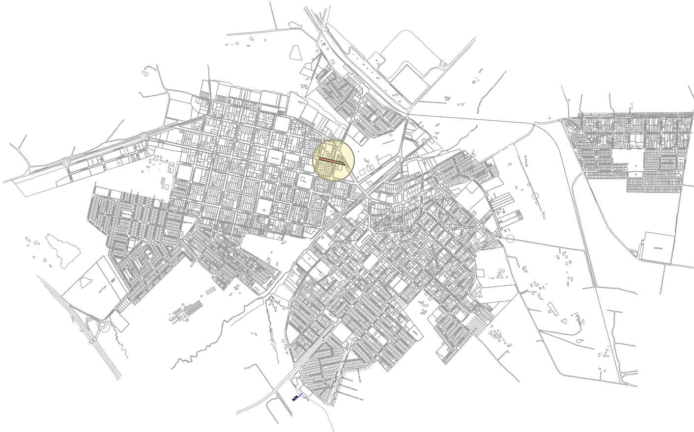
LOCALIZAÇÃO SEM ESCALA